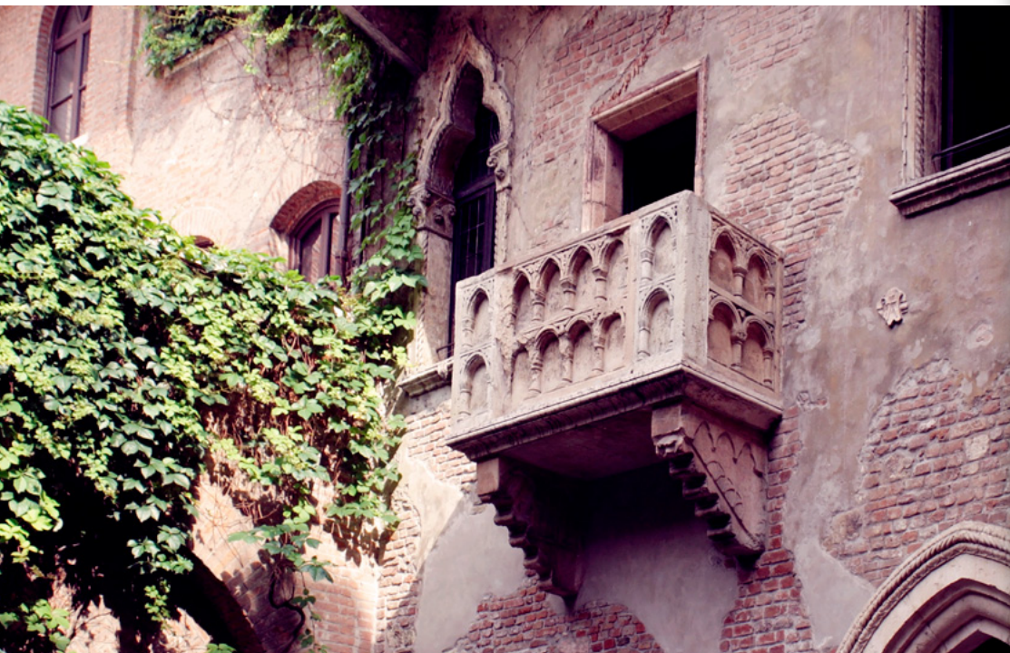
Particolare della casa di Giulietta, Verona

Verona è stata decretata dall'UNESCO "patrimonio storico e culturale dell'umanità". Città d'arte, di business e di turismo: teatri, mostre, eventi culturali e una grande e differenziata ospitalità alberghiera rendono la città e i suoi dintorni (il lago di Garda, la Lessinia) un polo di attrazione tra i più importanti in Italia.