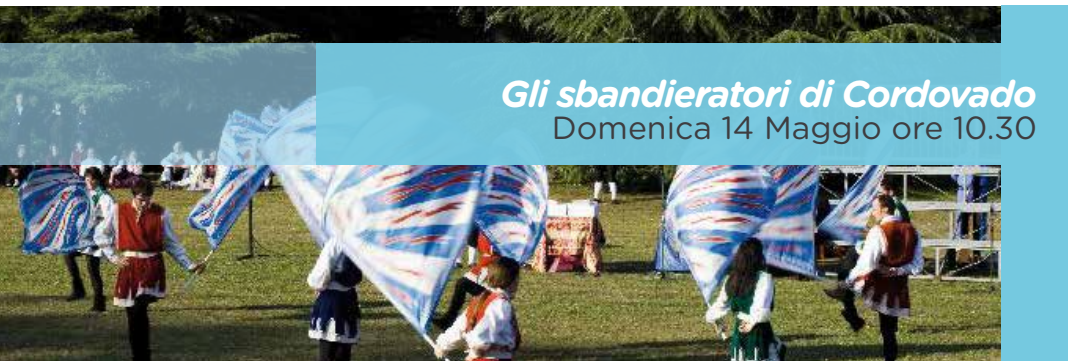
Gli sbandieratori di Cordovado Domenica 14 Maggio ore 10.30